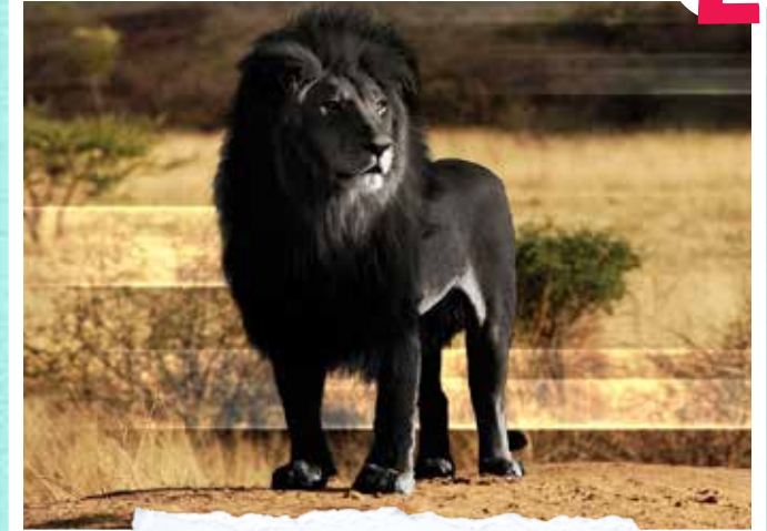
Une rare espèce de lion