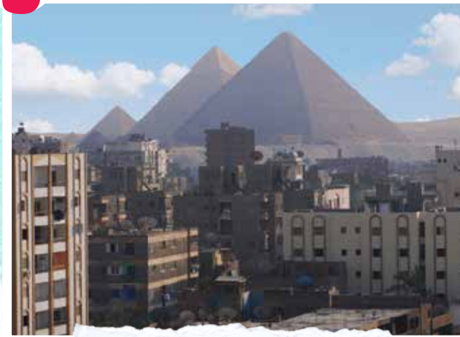
Des pyramides dans la ville