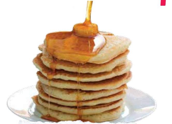
Un petit déjeuner parfait