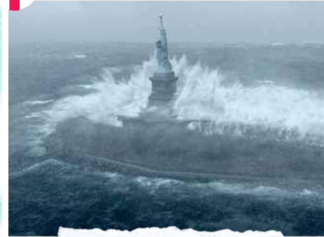
L'ouragan Sandy frappe New York